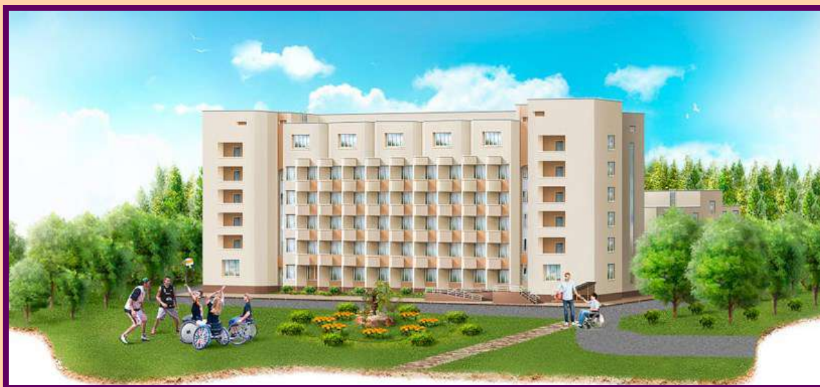
ГАУ города Москвы «Научно- практический центр медико –социальной реабилитации инвалидов»